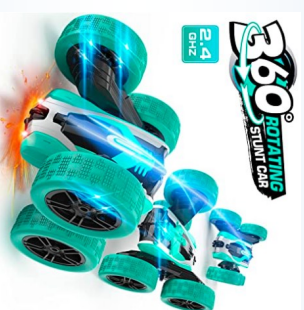
3B. REMOTE CONTROL CAR