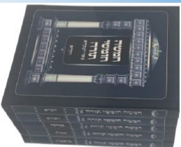
2A. POCKET SIZE CHUMASH